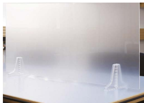
SDシリーズ M サイズ フロスト 使用例