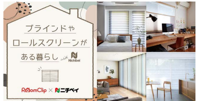
<投稿キャンペーンバナー>

ニチベイ商品の詳細はニチベイサイト（ www.nichi-bei.co.jp ）にてご覧ください。