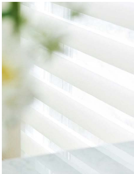
ジョルノ 7色 (シークレット・シースルー) どんなお部屋にも合う、シンプルで カジュアルなカラーラインアップ。

上質な質感と使いやすいカラーバリエーションで、インテリアテイストや好みに合わせて選べる 3 種類の生地、全 17 アイテムを新しくラインアップしました。全柄防災・抗菌仕様。