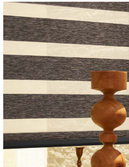
ソワレ 3色 (遮光・シースルー) 採光も遮光もできる、選びやすい グレイッシュトーンのファブリック。