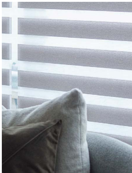
ルシード 7色 (シークレット・シースルー) ほのかな光沢感を持つ、 スタイリッシュで上品な表情。