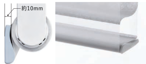
ボトムレールは生地で巻き込んだすっきりとしたデザイン