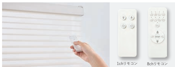
RFリモコンは2種類。8chリモコンは最大8台までの個別・一斉操作が可能