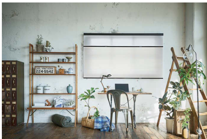
4月新発売 ハニカムスクリーン「レフィーナ」