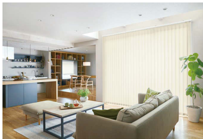
4月新発売 「ポポラ 2」