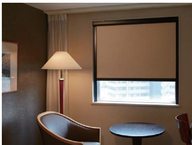
ロールスクリーン「ソフィー」小型ガイドレールタイプ