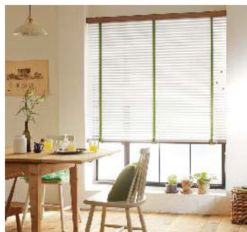
よこ型ブラインド「クオラ」