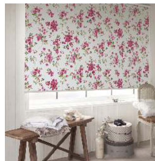
ロールスクリーン「ソフィー」