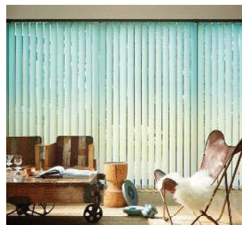
たて型ブラインド「アルペジオ」