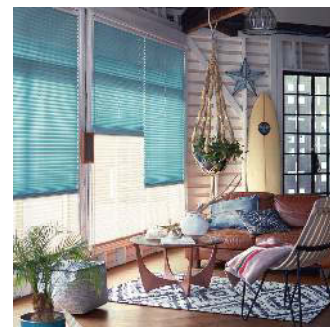
プリーツスクリーン「もなみ」