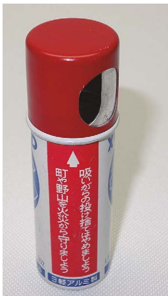
火災防止のために