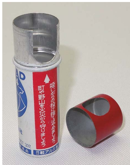
街の美観のために