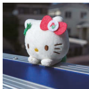
ぴよこんと乗ります