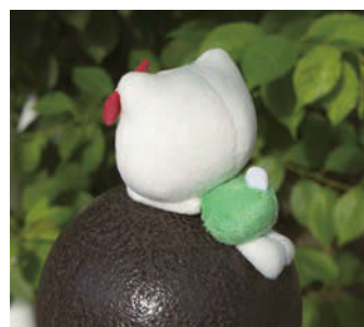
後ろ姿もかわいい