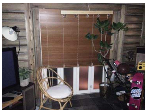
3兄弟自宅リビング 「ポポラ バンブーブラインド」

櫻井美咲は、独立したいという夢に向け日々パティシエの仕事にまい進してきたため、すっかり恋愛にご無沙汰。ある日、心のよりどころとしていた仕事をクビになり、転職活動もうまくいかないという大ピンチに……。そんな折、高校時代の初恋の人・柴崎千秋と再会し、彼が経営する湘南のレストランで住み込みのバイトをするという奇跡の展開に！憧れの千秋とひとつ屋根の下で暮らすことになった美咲だが、そこには他にも兄弟たちがいた。シェフを目指して学校に通う三男の冬真は、お調子者のプレイボーイ。レストランを支える天才シェフ・二男の夏向は、最低最悪の超ムカツク男だった……。海辺のレストランを舞台に、ケーキ作りに人生を捧げてきたパティシエのヒロインが、イケメン三兄弟とシェアハウスしながら恋愛模様を繰り広げるロマンチック・ラブ・コメディ。