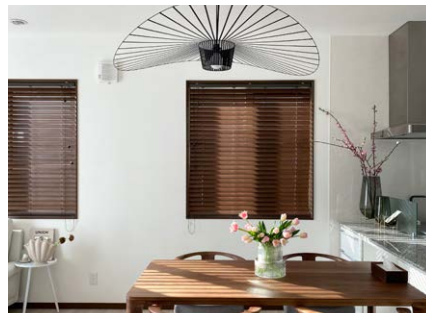
お名前： mii さま 商品名： popola2「バンブーブラインド」