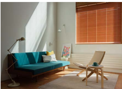
お名前： me.t.cise さま 商品名： ウッドブラインド 「クレールグランツ」