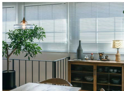
お名前： gami さま 商品名： ベネシャンブラインド 「セレーノグランツ」