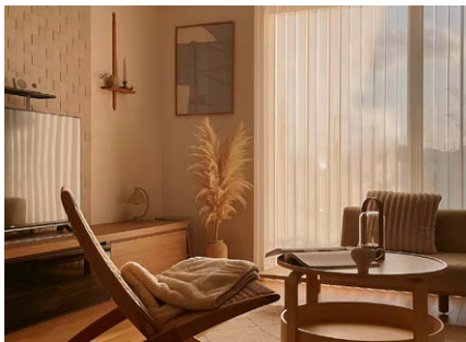
お名前： みず さま 商品名： パーチカルブラインド「アルペジオ」