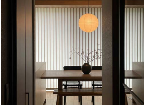
お名前： @srou_je by suzu さま 商品名： パーチカルブラインド「アルペジオ」