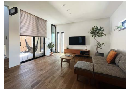
お名前： さっきん さま 商品名： 調光ロールスクリーン「ハナリ」