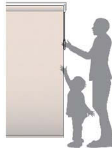
子どもの手が届かない!