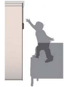
ソファや椅子で操作部に届いても、1本のコードなので危険が少ない。